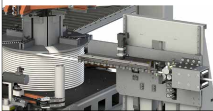
Abb. 5 Verlegeinheit