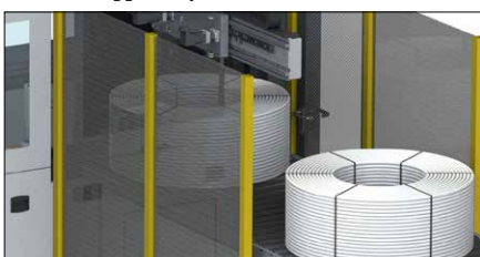
Abb. 8 Ringauswerfer