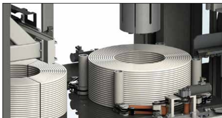
Abb. 7 Ringgreifersystem