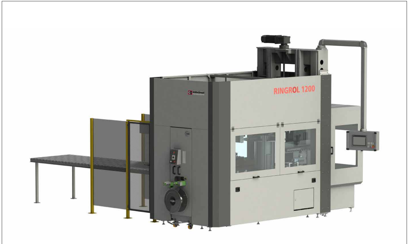
Abb. 1 RINGROL 1200 mit Schutzzaun und Rollenbahn