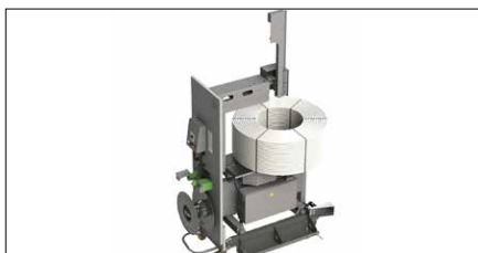
Abb. 9 Umreifungsstation für PP-Band