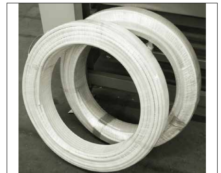
Abb. 3 Fertigprodukt