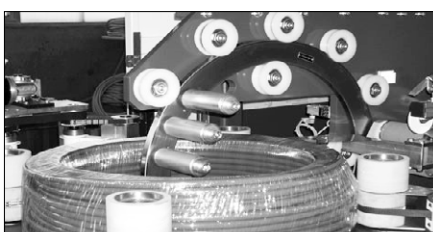
Abb. 10 Einwickelstation für Stretchband