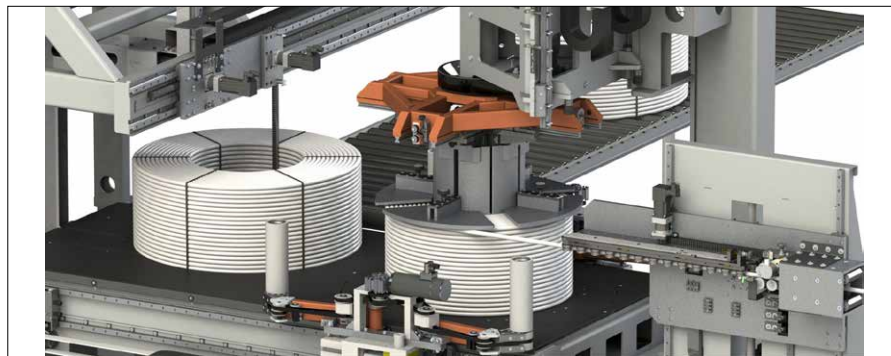
Abb. 2 Funktionsprinzip