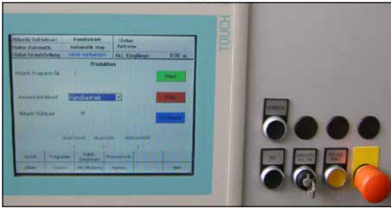
Abb. 4 Bedienpanel